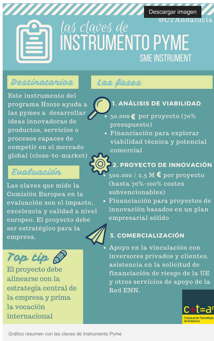
Gráfico resumen con las claves de Instrumento Pyme

Las empresas españolas han vuelto a arrasar en el último corte del programa Instrumento Pyme (SME Instrument), una de las herramientas estrella del programa marco de la UE para investigación e innovación Horizonte 2020 y que está dotada de 3.000 millones de euros para el periodo 2014-2020. España se ha situado, con diferencia, como el país con mayor volumen de empresas que recibirán financiación en el corte de enero pasado de la fase 2 de Instrumento Pyme. Además, España lidera también el total acumulado de empresas que han pasado la fase dos de este programa, con 132 pymes, que suponen más de la quinta parte del total de pymes de toda la UE que han conseguido esta financiación (658).